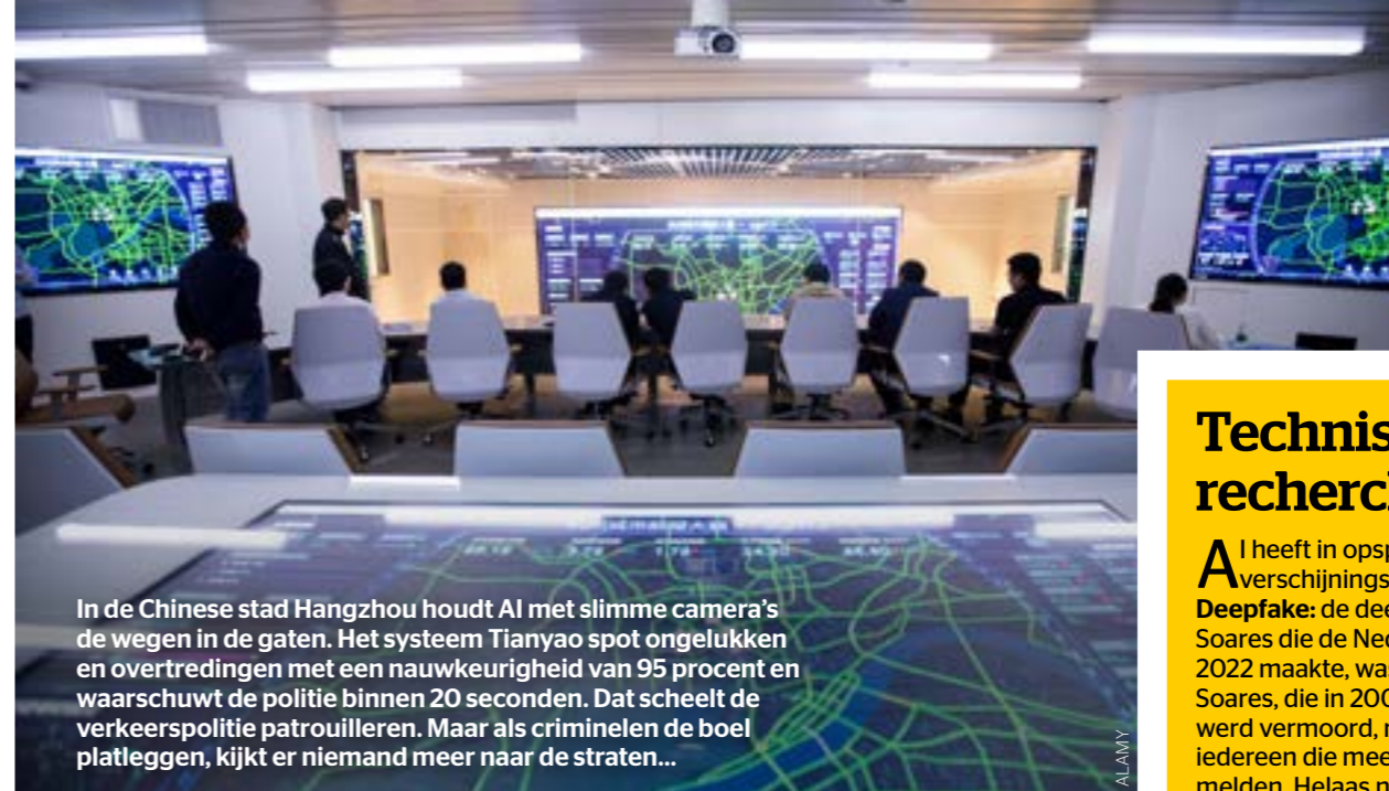
In de Chinese stad Hangzhou houdt AI met slimme camera's de wegen in de gaten. Het systeem Tianyao spot ongelukken en overtredingen met een nauwkeurigheid van 95 procent en waarschuwt de politie binnen 20 seconden. Dat scheidt de verkeerspolitie patrouilleren. Maar als criminelen de boel platleggen, kijkt er niemand meer naar de straten...

bijvoorbeeld van boven staan, om het AI-model te verfijnen. Dat maakt het geschikter voor ons werk.' De Nederlandse politie ontwikkelt, in tegenstelling tot veel andere landen, veel AI-systemen zelf. 'Dan weten we met welke data het is gevoed en hoe het presteert.'